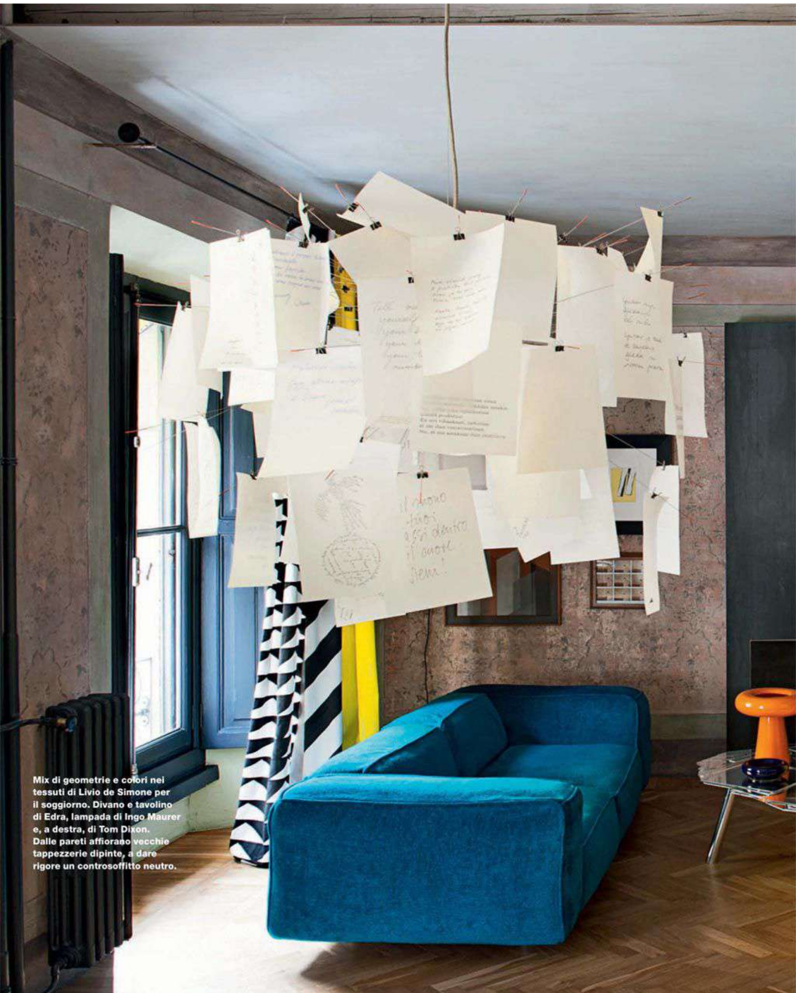
Mix di geometrie e colori nei tessuti di Livio de Simone per il soggiorno. Divano e tavolino di Edra, lampada di Ingo Maurer e, a destra, di Tom Dixon. Dalle pareti affiorano vecchie tappezzerie dipinte, a dare rigore un controsoffitto neutro.