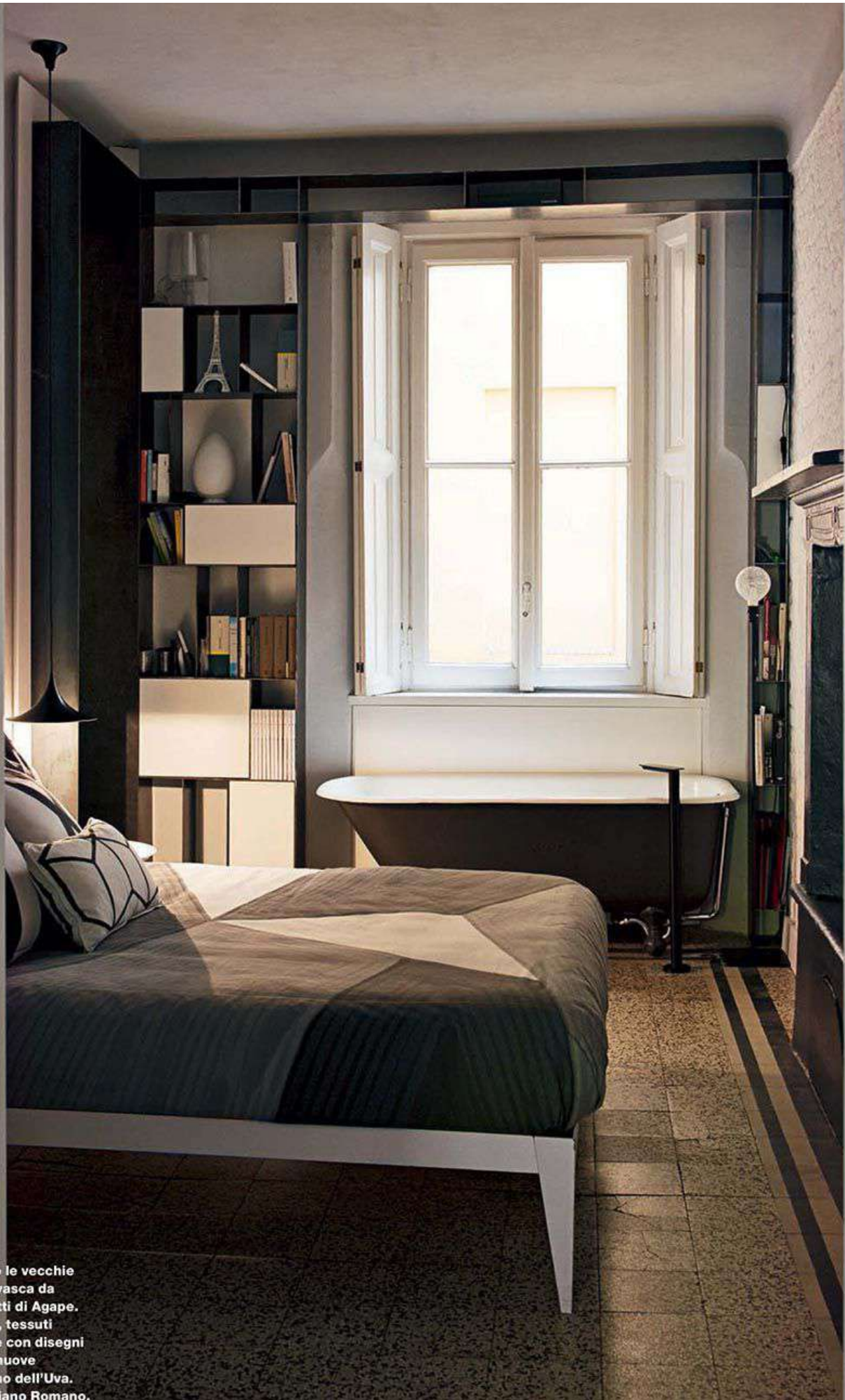
In camera da letto le vecchie cementine e una vasca da bagno con rubinetti di Agape. Accanto, sul letto, tessuti di Livio de Simone con disegni riproporzionati e nuove grafiche di Giuliano dell'Uva.