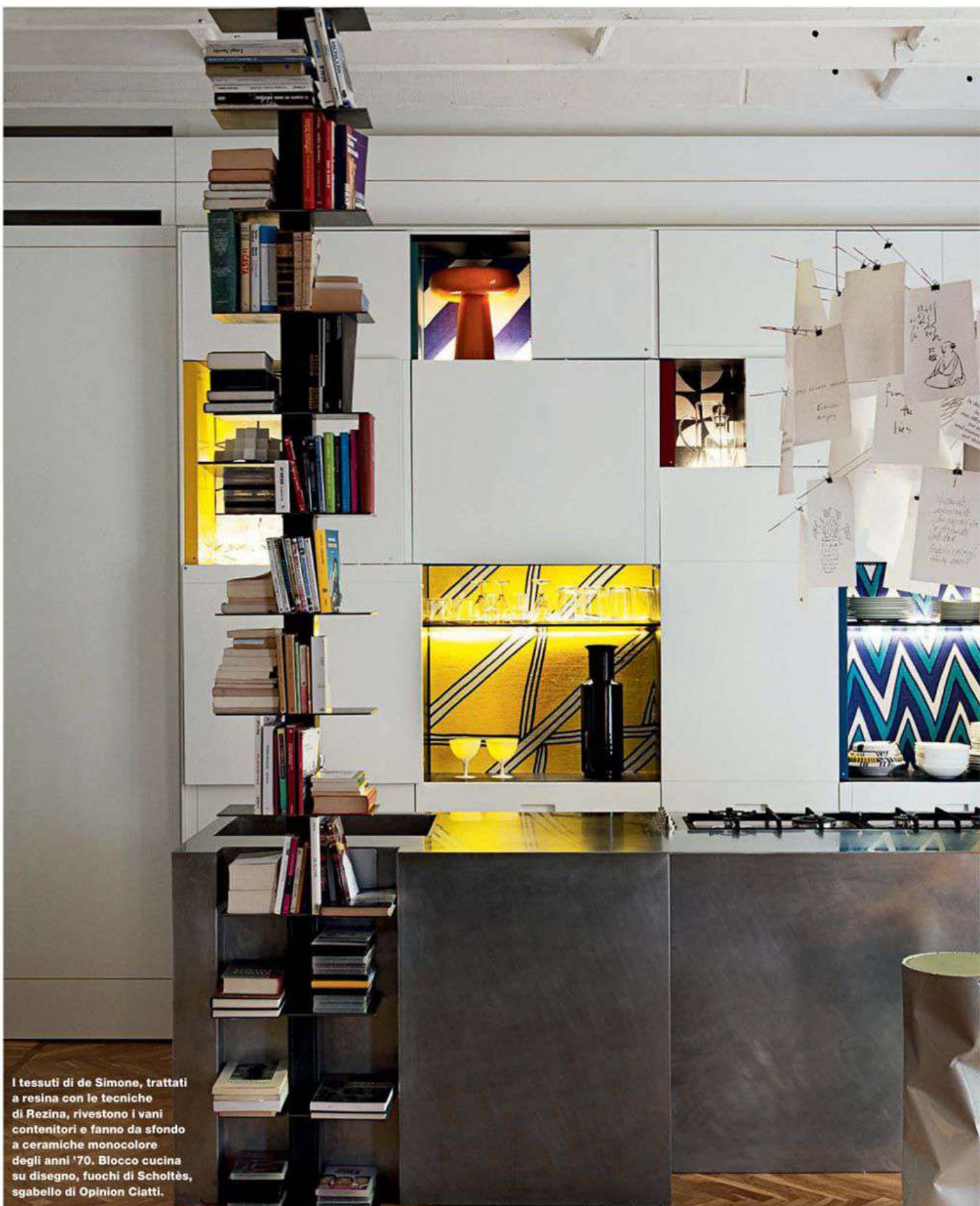
I tessuti di de Simone, trattati a resina con le tecniche di Rezina, rivestono i vani contenitori e fanno da sfondo a ceramiche monocolori degli anni '70. Blocco cucina su disegno, fuochi di Scholtès, sgabello di Opinion Ciatti.